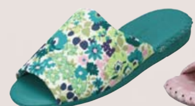
9374 ¥3,800+税 カラー：ローズ・オレンジ・グリーン サイズ：S・M・L