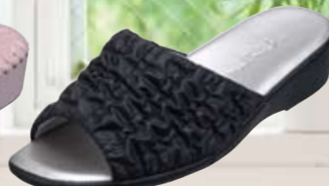
9434 ¥4,300+税 カラー：ブラック・レッド・ホワイト サイズ：S・M・L