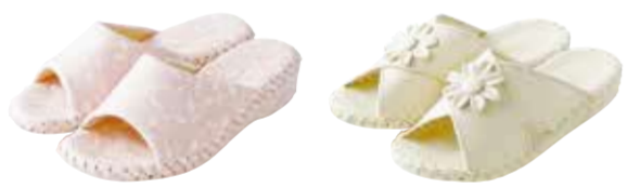
#9414 カラー：ピンク・グリーン・アイボリー サイズ：S・M・L