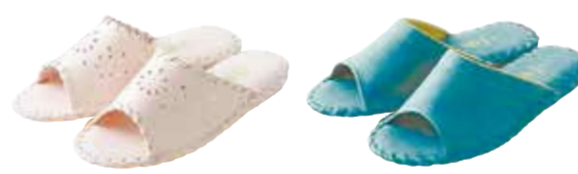
#9502 カラー：ブルー・イエロー・ピンク・アイボリー・ローズ・グリーン サイズ：S・M・L