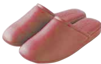
#9393 カラー：ワイン・オレンジ・グリーン サイズ：S・M・L