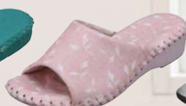
9414 ¥4,000+税 カラー：グリーン・ピンク・アイボリー サイズ：S・M・L