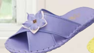
9500 ¥3,300+税 カラー：ラベンダー・バイオレット・ベージュ・レッド・ゴールド サイズ：S・M・L