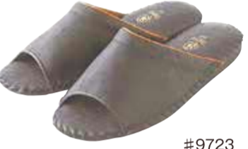
#9723 カラー：ブラック・ブラウン・グレー サイズ：M・L・LL・XL (XLはブラックとブラウンのみ)