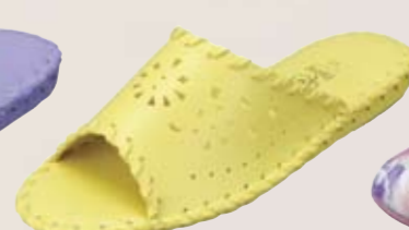
9502 ¥3,300+税 カラー：ブルー・イエロー・ピンク・アイボリー・ローズ・グリーン サイズ：S・M・L